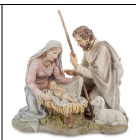
Б) Рождество Христово